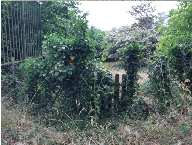
Photographies du chemin rural n°2