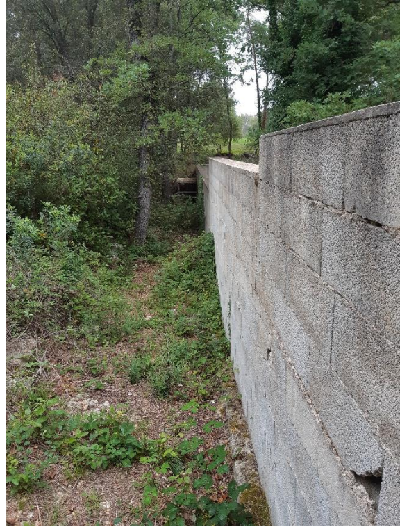
Photographies du chemin rural n°3