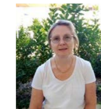
Les agents municipaux travaillant aux côtés des enseignants et des enfants de maternelle.

Divers intervenants et sorties sont déjà prévus pour cette année :