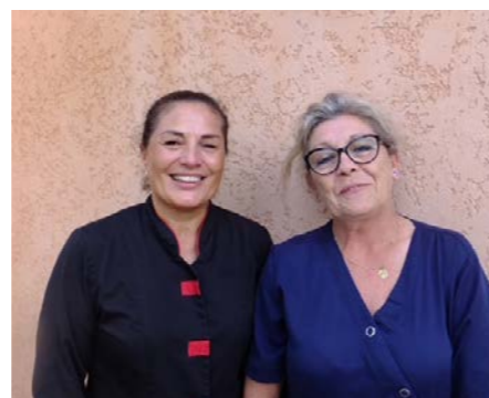
«équipe entretien cuisine»

Chaque mois, les enfants partent à la découverte d'un pays par le biais d'activités manuelles, de chansons, de musique mais aussi de dégustations culinaires. Enfin, tous les derniers vendredis du mois un goûter d'échanges entre parents, enfants et professionnels de la structure sera proposé.