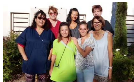
Les agents municipaux travaillant à l'école élémentaire.

Méditerranée 2000 en lien avec la table de tri des déchets installée au réfectoire ainsi que les composteurs.