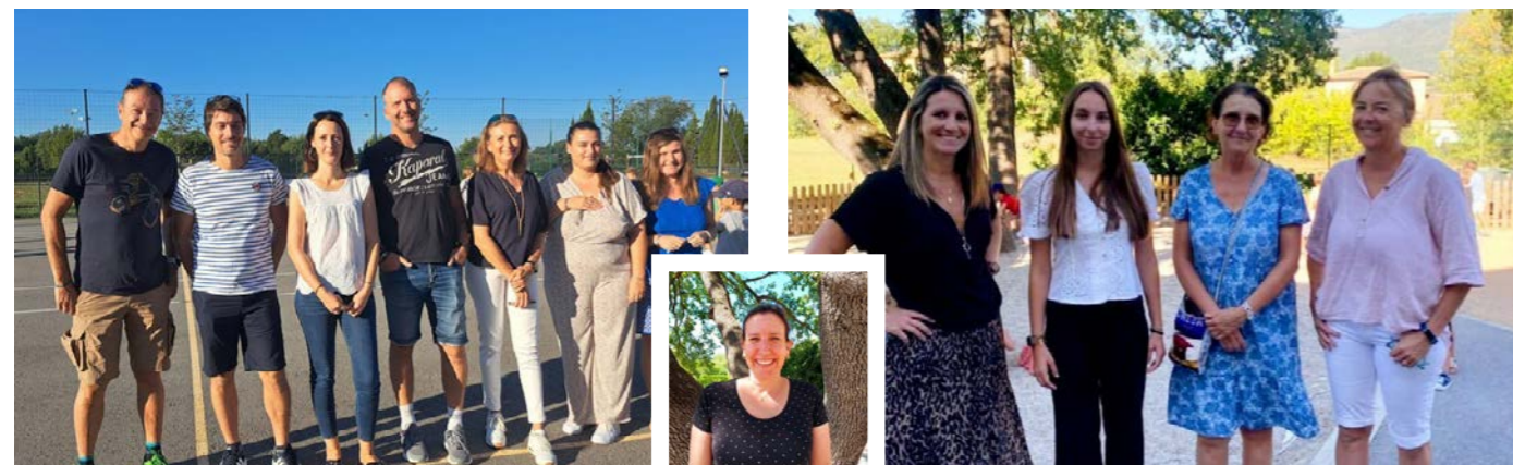
Photo 1 instituteurs d'élémentaire - Photos 2 et 3 : institutrices de maternelle

- Désormais 4 classes en maternelle , cette rentrée 2023/2024 étant marquée par l'ouverture d'une 4 ème classe pour les petits. 99 enfants y sont scolarisés, entourés d'une équipe de 6 enseignants répartis sur les différentes classes per-