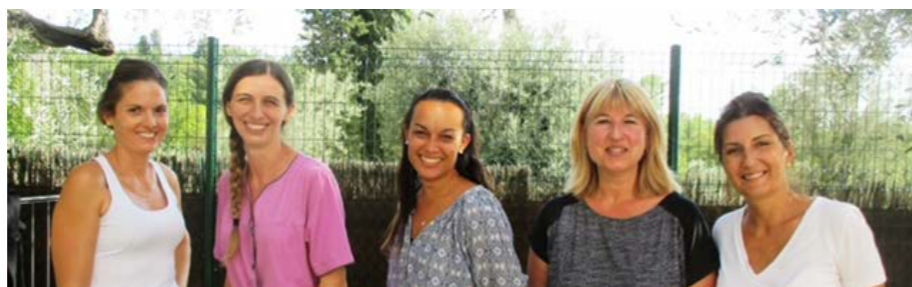
«équipe moyens et grands»

La Structure est engagée dans une démarche «Ecolo-crèche» avec la mise en œuvre d'une production des repas sur place avec des produits 100% brut et Bio. Le pain est préparé sur place à base de farines Bio, les produits d'entretien sont éco-labellisés et une attention particulière est portée sur le choix du mobilier, des peintures, etc... pour le respect de la qualité de l'air à l'intérieur de la structure.