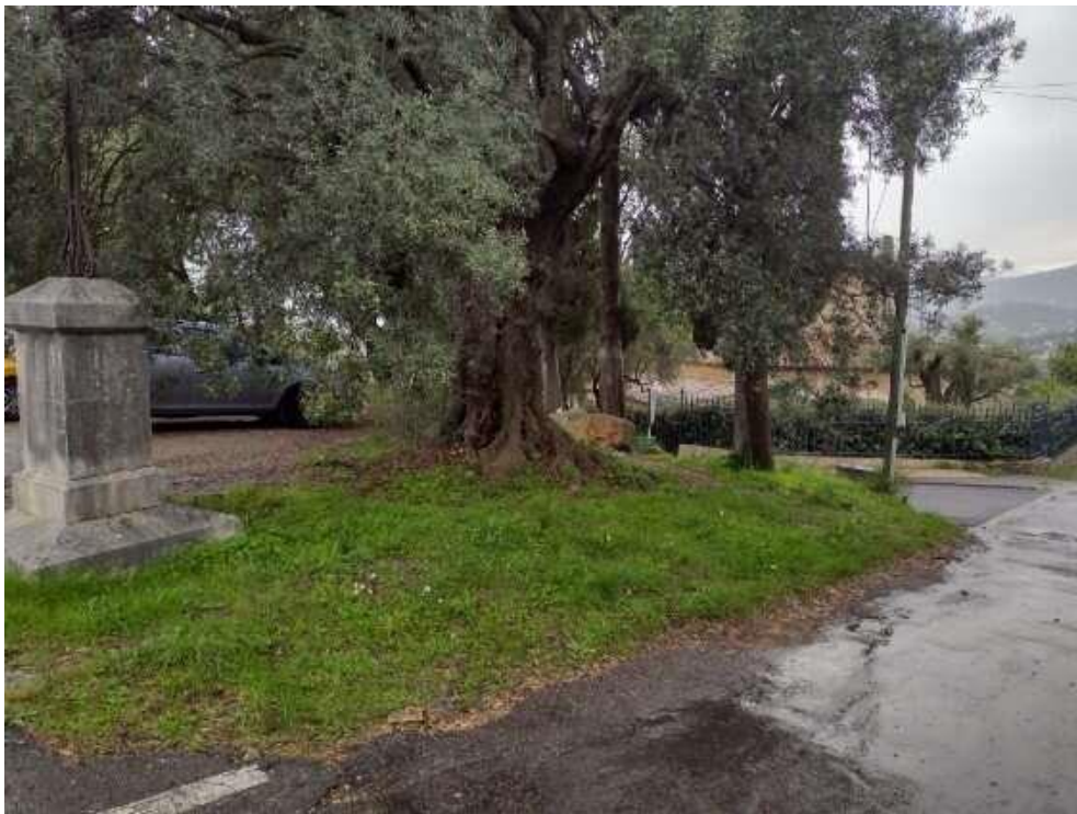
Depuis l'aire San Peyre, vue sur l'entrée du chemin rural du Saut