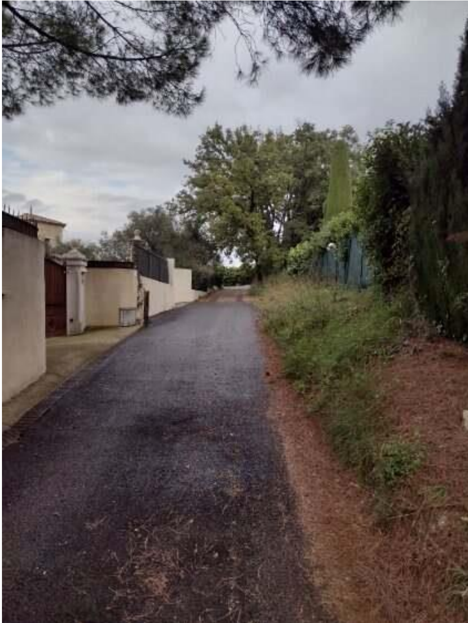
Chemin rural du Saut, vers le chemin du Saut