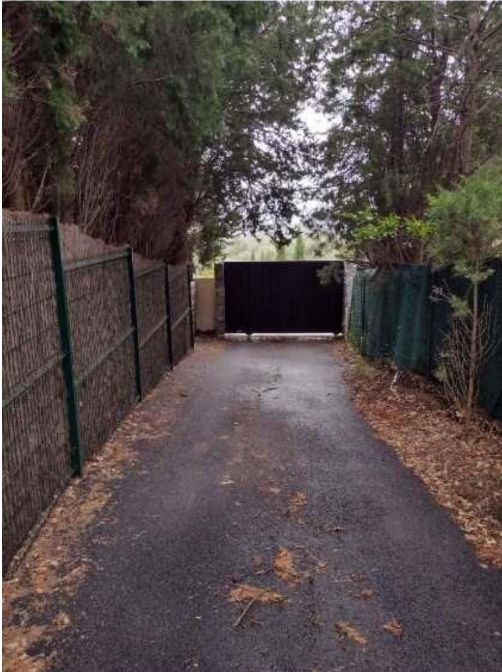
Portail matérialisant la limite entre la partie de chemin rural du Saut désaffectée et celle non désaffectée