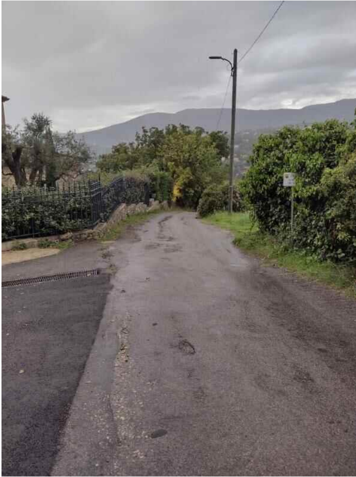
Vue sur le chemin du Saut