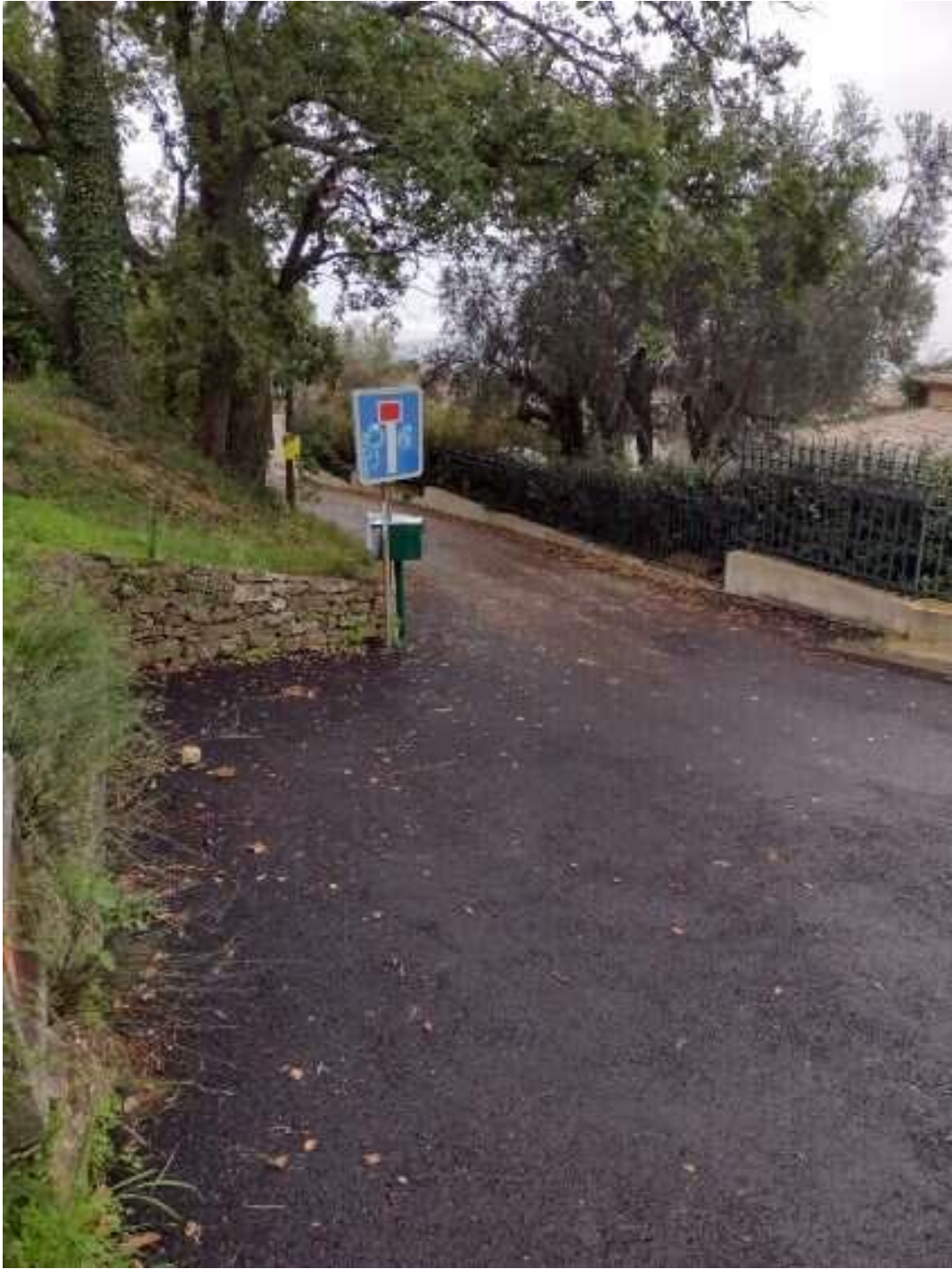
Entrée du chemin rural du Saut